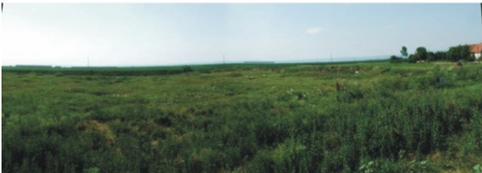
Pogled na lokalitet - sa ivice puta Novi Sad – Titel