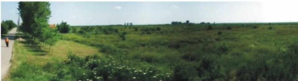
Pogled na lokalitet - sa ivice puta Novi Sad – Titel